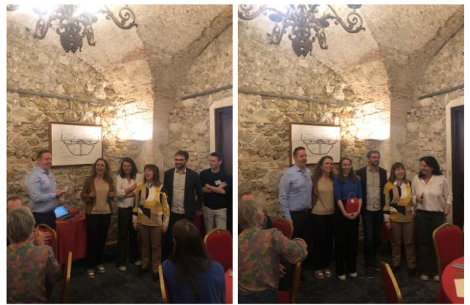
Remise des prix par le président et le trésorier de la SOFPEL entourés du comité local, lors de la soirée de gala aux Arsenaux.

pointe de la recherche clinique et fondamentale et des traitements. Il s'est déroulé sur 3 jours du 1 er au 3 décembre 2022. Le premier jour a été consacré aux mécanismes impliqués dans les troubles posturo-locomoteurs, notamment dans la maladie de Parkinson et les ataxies, depuis leurs traitements actuels jusqu'aux évolutions les plus prometteuses. Le deuxième jour a eu pour thème l'adaptation sensorimotrice tout au long de la vie. Ont été évoqués le rôle des modalités sensorielles dans l'encodage des mouvements corporels, l'implication des processus cognitifs dans le contrôle postural et locomoteur et les représentations du corps au cours du développement.